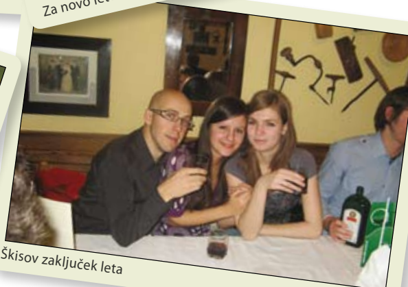
Škisov zaključek leta