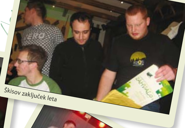
Škisov zaključek leta