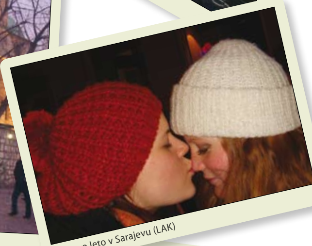
Za novo leto v Sarajevu (LAK)