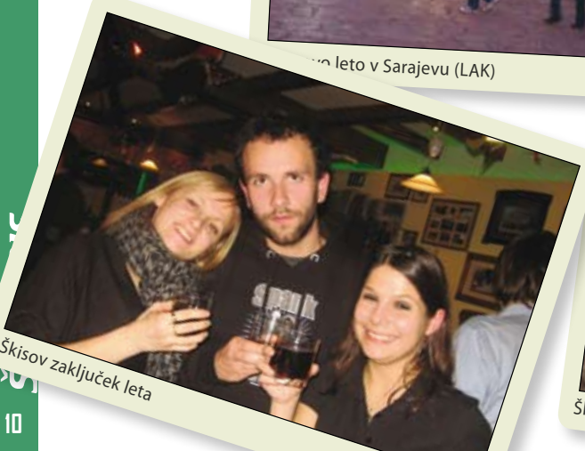
Škisov zaključek leta