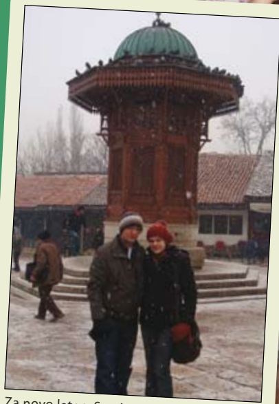
Za novo leto v Sarajevu (LAK)