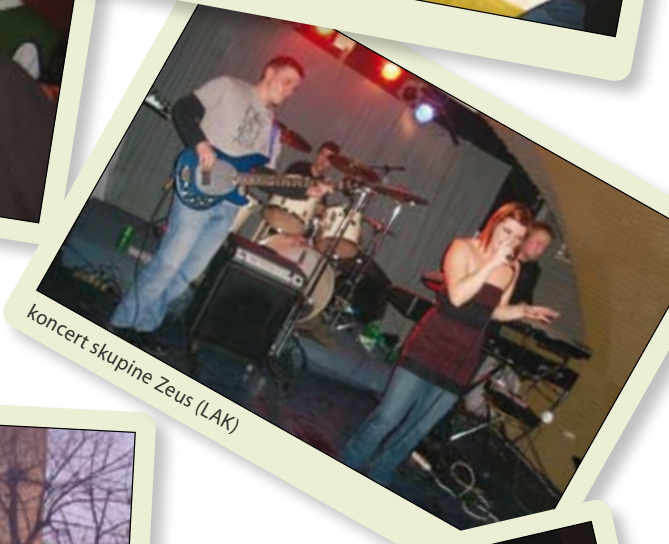
koncert skupine Zeus (LAK)