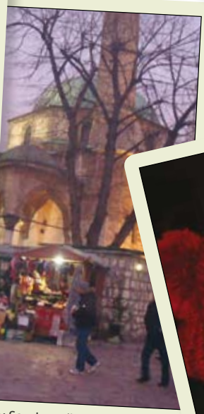
...o leto v Sarajevu (LAK)