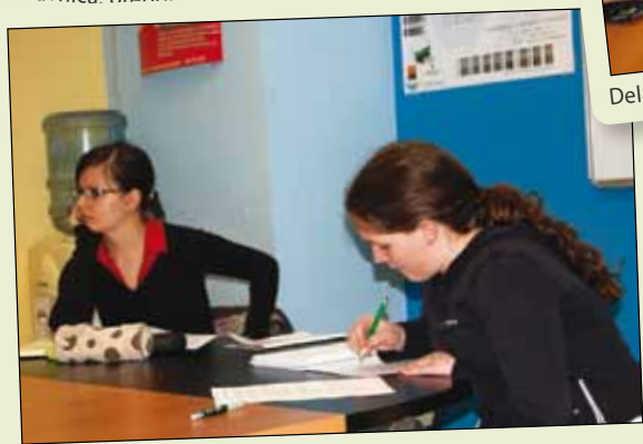
Delavnica: davčno svetovanje za klube