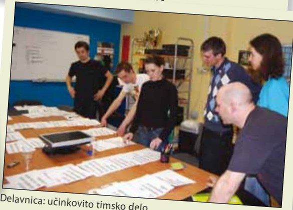
Delavnica: učinkovito timsko delo