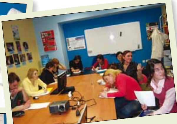
Delavnica: prepričljiv javni nastop