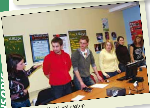
Delavnica: prepričljiv javni nastop