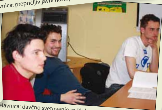
Delavnica: davčno svetovanje za klube